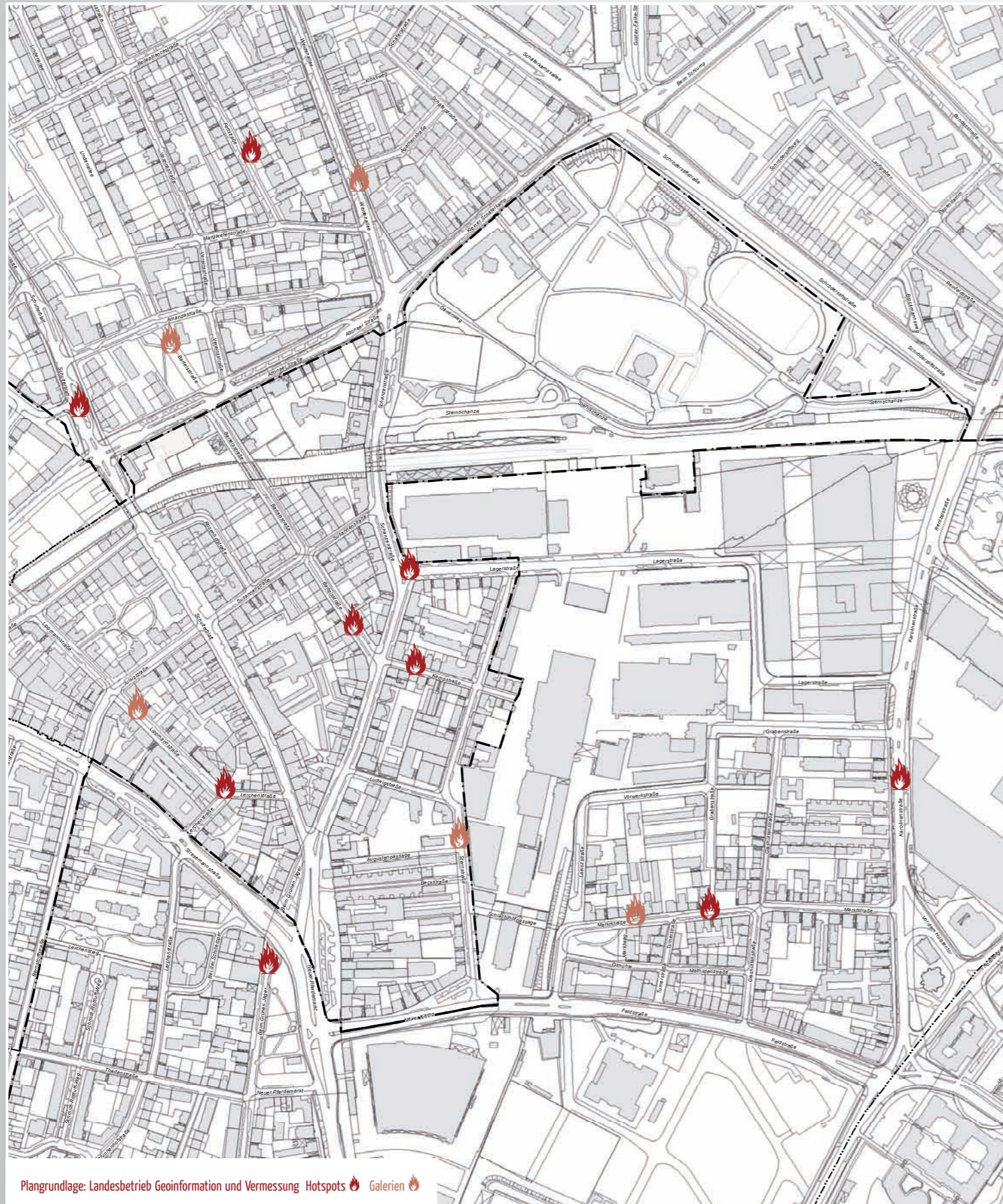
Plangrundlage: Landesbetrieb Geoinformation und Vermessung Hotspots Galerien